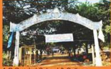
A.P Gurukul School & College