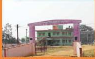
Agriculture Market Committee Office