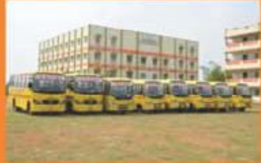
Sree Vahini Engg. College